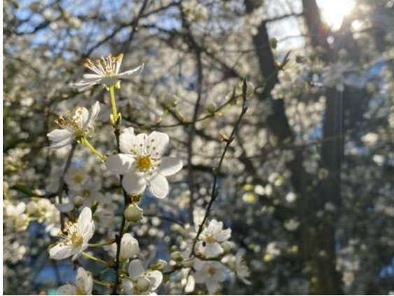
En solig dag på våren

Bra ljus är viktigt för att få skarpa bilder. Ta bilder från olika håll och jämför hur solljuset skiner på växten. Se upp så att du själv inte skuggar växten som du ska fota. Du kan också prova att fota på olika delar av dagen. Ljuset är mjukare på morgonen och mot kvällen, jämfört med mitt på dagen. Ljuset skiftar också mellan årstiderna.