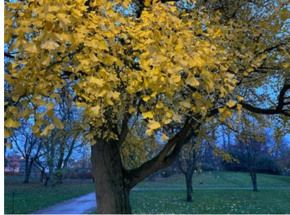
En gatlampan lyser upp trädet en höstkväll